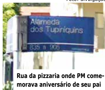
Rua da pizzaria onde PM comemorava aniversário de seu pai

Segundo dados da Secretaria da Segurança Pública (SSP), entre janeiro e setembro de 2020, o 27º DP