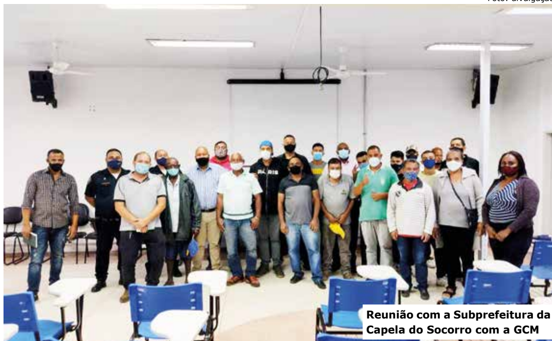
Reunião com a Subprefeitura da Capela do Socorro com a GCM