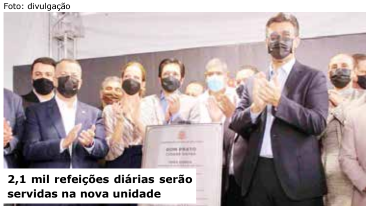
2,1 mil refeições diárias serão servidas na nova unidade