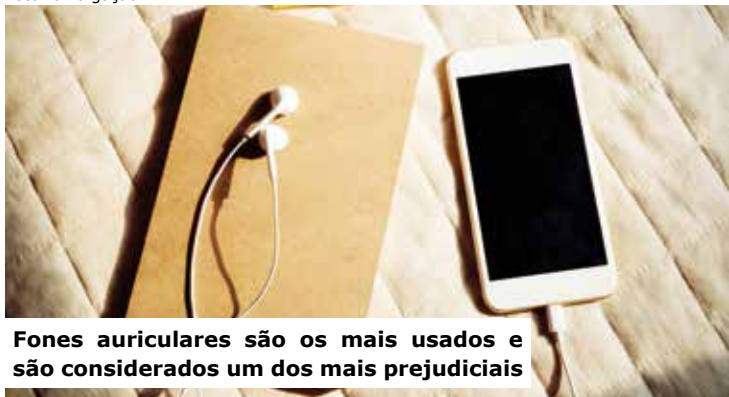
Fones auriculares são os mais usados e são considerados um dos mais prejudiciais

Por Redação reportagem@gruposulnews.com.br