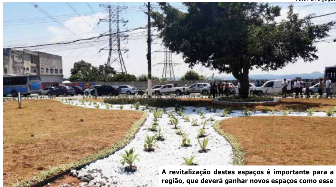
A revitalização destes espaços é importante para a região, que deverá ganhar novos espaços como esse

Por Redação reportagem@gruposulnews.com.br