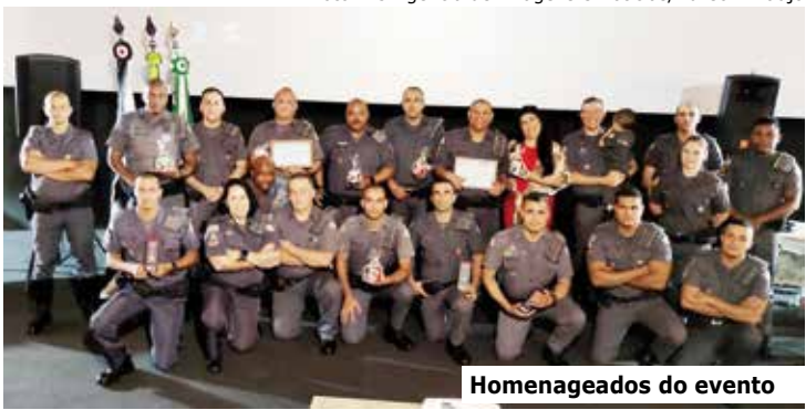
Homenageados do evento