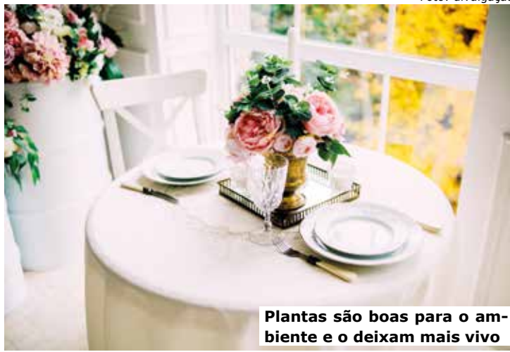
Plantas são boas para o ambiente e o deixam mais vivo

É importante primeiro pensar nos vasos, pensar em um modelo que harmonize com o estilo de decoração, tons neutros sempre combinam com tudo, para quem tem pouco espaço, a dica fica em decorar nas mesas, aparadores, nichos e prateleiras, existem modelos que servem para esse tipo de decoração. Já para plantas e vasos grandes, é uma boa ideia escolher em cantos, onde não atrapalha a circulação. Uma dica para a escolha do tamanho do vaso para equilibrar o visual é o vaso ter, proporcionalmente, um terço da altura da planta.